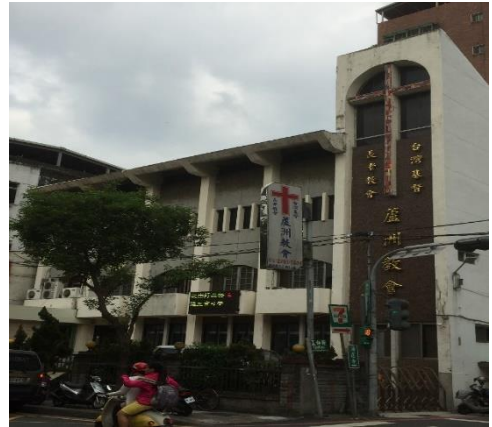
圖 4-3-10 蘆洲長老教會

蘆洲長老教會為基教長老教會第一代馬偕博士在西元 1874 年 6 月 23 日創立，其遺著《台灣記》中即有記載。據說為了避免當時頑民的搗毀，和尚洲、八里坌、錫口等最古教堂建築的屋頂，都不敢標立十字架，而是裝飾小型寶塔，以迎合一般群眾，蘆洲長老教會也是如此。長老教會自創建以來，一直默默隨著蘆洲的成長，並提供一處信仰和心靈憩息的場所。教堂總共歷經四次重建，目前所見的四層樓房，是在民國 67 年重建完成。