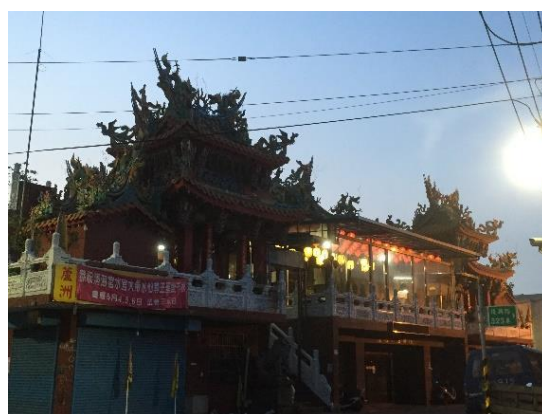
圖 4-3-9 清海宮見證蘆洲水湳地區，曾經和社子有過密切的的水運關係

蘆洲早年因長期淹水頻繁，又以務農為主，因此發展出祭祀水神的文化，清海宮主祀神為水仙尊王，每年五月五日端午節的淡水河龍舟競賽，是它的一大特色。在民國 79 年（西元 1990 年）以前，即未建清海宮以前，蘆洲水仙尊王金尊乃是由水湳地區擲頭家、爐主輪流祭祀，從清朝時期開始，蘆洲跟對岸的社子每年端午節都聯合進行龍舟競賽活動，直到日據及戰後初期都盛行不衰，顯地的共同信仰。然而隨著水運逐漸沒落，社子有過密切的的水運關係這項蘆洲與社子龍舟競渡的宗教活動，在光復後逐漸消失在淡水河的水域上，兩岸(蘆洲與社子島)的居民的互動已不復以往。