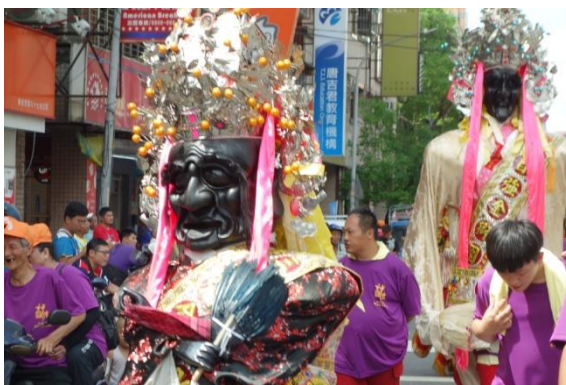
圖 4-3-3 七爺八爺繞境出巡