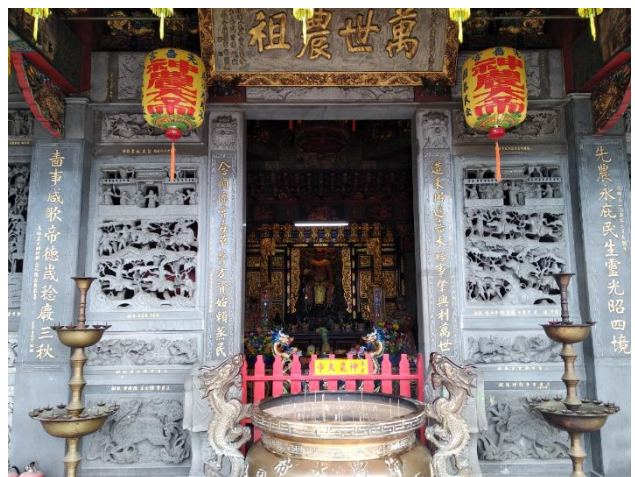
圖 4-3-1 先嗇宮供奉的神農大帝由福建恭請來台

「先嗇宮」創建於清乾隆初期，是三重唯一一座歷史悠久的三級古蹟，又名「五穀先帝廟」，主要供奉「神農大帝」，傳說中，神農氏嚐百草並且教導人們農耕的技術，因此，先民為了農事興盛並希求風調雨順、國泰民安，特地從福建恭請來台，也見證了農業移墾時代的先民，期望五穀