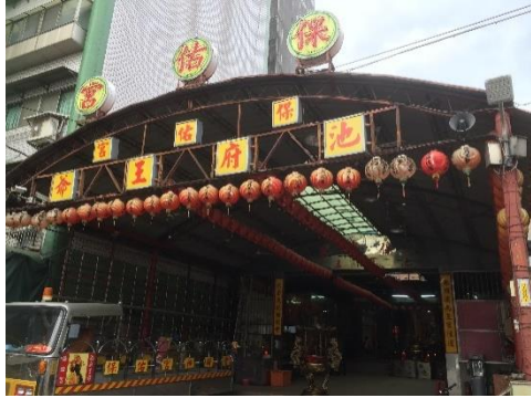
圖 4-3-6 保佑宮內的建廟沿革石碑和陳維英撰寫