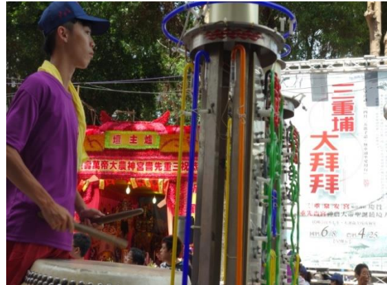
圖 4-3-2 熱鬧滾滾的三重大拜拜

「三重大拜拜」(提早一天農曆四月二十五日宴客)因此產生，每年在這個日子，三重家家戶戶都會辦流水席宴請各地親朋好友，在 50 年代高峰期，號稱每年可以「吃掉一條中興大橋」，這樣的具有濃烈信仰的節慶廟會活動，不僅反映了早期先民敬天惜福的價值與信念，也拉近了宗親、朋友、客戶等社會關係網絡的距離，成為地方特色民俗的一種文化表現。