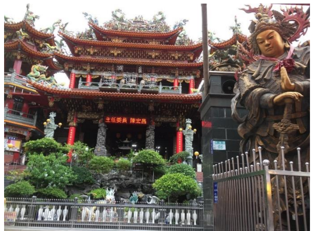
圖 4-3-5 湧蓮寺奉祀的觀世音菩薩來自浙江省普陀山

民國八年(1919)再次擴建，前殿供奉觀音佛祖，後殿懋德宮奉祀國姓爺鄭成功。根據懋德宮〈鄭成功祭祀記〉記載，蘆洲為泉州人開墾聚集之處，嘉慶