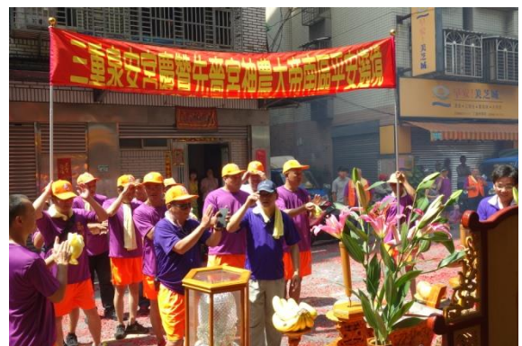
圖 4-3-4 眾多宮廟參與遶境活動