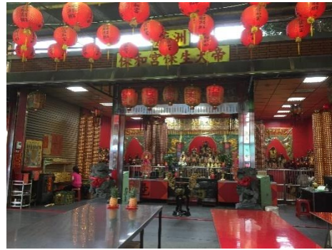
圖 4-3-7 保和宮供奉泉州人的神祇保生大帝